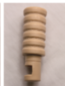
Tráquea membrana del tejido del cuello