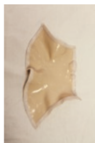
Piel de cuello