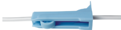
Interruptor de control apagado

B. Conecte el conector de la bolsa de fluido al puerto de la bolsa y gírelo en el sentido de las agujas del reloj para conectarlo bien. Gire el interruptor giratorio al modo de cateterismo.