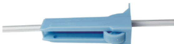
Interruptor de control encendido

C. Encienda el regulador para comenzar a practicar el cateterismo.