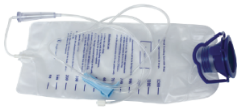
Bolsa de líquido